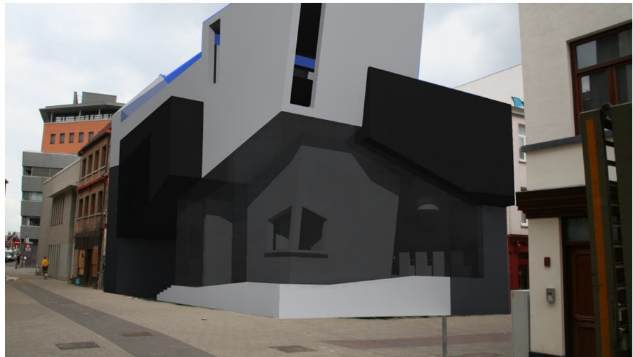
ZICHT VANUIT DE STRAAT OP DE CINECITTA - INKOM

Dit brengt mij tot een derde ambitie: circulatie Een goede doorstroming of circulatie zorgt ervoor dat de cinema kan uitgebaat worden door zo weinig mogelijk personeel. Dit is in het ontwerp verwerkt door 2 aparte trappen-systemen te voorzien, één voor de bezoekers en één voor het personeel. Het personeel heeft met 1 trap toegang tot het onthaal, de cafetaria, de projectiezalen en het kantoor. Dit geheel is de kern van het gebouw. Er rond bevinden zich de publieke plaatsen zoals de cafétaria, het terras, de toiletten en de zalen