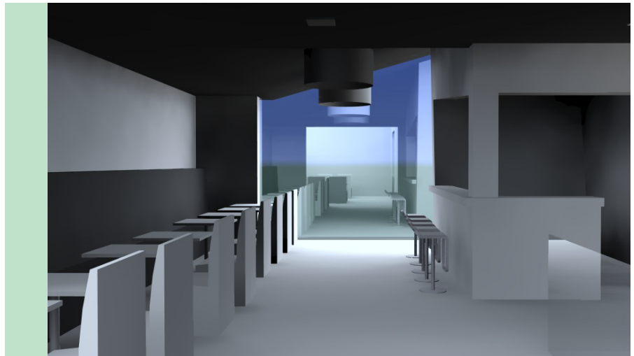
EEN ZICHT OP DE CAFÉTARIA